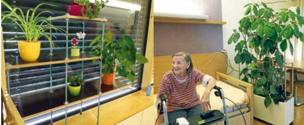
BewohnerInnen und MitarbeiterInnen freuen sich über die neuen Pflanzen.

oder weniger mit Grünpflanzen und Gärtnern verbunden, weshalb diesen auch jeweils eine andere Bedeutung zukommt. Andererseits gibt es auch in Bezug zur Grünpflege verschiedene Vorlieben. So sind hier auch Personen vertreten, die lieber gar nicht damit belastet werden möchten. „Ich schau sie mir gern an, aber pflegen mag ich's eigentlich nicht. Ich will nicht belastet werden.“ (Herr C.).