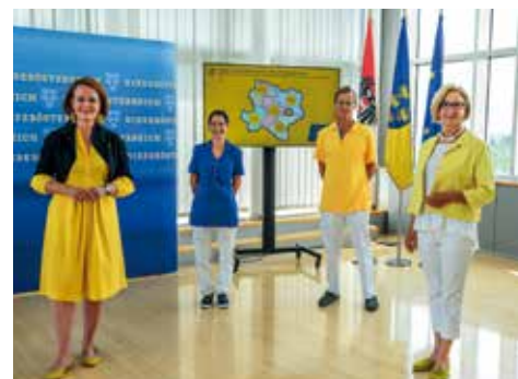
Landeshauptfrau Johanna Mikl-Leitner und Sozial-Landesrätin Christiane Teschl-Hofmeister informieren über die Modernisierung und den Ausbau der stationären Pflege und Betreuung in NÖ. Im Bild mit einer Mitarbeiterin und einem Mitarbeiter eines Pflege- und Betreuungszentrums.

Mit diesem Ausbau- und Modernisierungsprogramm trage man auch der demografischen Entwicklung Rechnung, so Teschl-Hofmeister. Der Anteil der über 60-Jährigen in Niederösterreich werde bis 2030 auf 32 Prozent steigen, der Anteil der über 75-Jährigen auf 12 Prozent. „Bis 2030 werden wir deshalb 1.970 zusätzliche Plätze in den Pflege- und Betreuungszentren brauchen“, sagte die Landesrätin. Es gelte deshalb, an den bestehenden Standorten zusätzliche Plätze zu schaffen und gleichzeitig auch den Komfort und die Qualität in den Häusern zu verbessern. Auch der Anteil der Einzelzimmer werde erhöht.