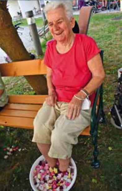
Die warme Jahreszeit mit allen Sinnen genießen!

Die leuchtend kräftigen Farben der üppigen Frühsommer-Blütenpracht haben die zarten Töne der Frühlingsblumen abgelöst. Jetzt ist es Zeit, Garten und Balkon zu genießen. Ganz nach dem Motto: die schönen Stunden nutzen, den Sommer bestaunen, schmecken und so richtig auskosten. Sommerbeginn ist die Zeit, in der der Duft von Wildrosen und Lavendel die Luft erfüllt, Holunder und Geißblatt blühen und Hortensien in strahlenden Farben die Hecken säumen. Sonnenschein am wolkenlosen Himmel lockt alle hinaus ins Freie, um den Sommer zu genießen. Die Hitze lässt dann rasch den Wunsch nach kühlenden Hand- und Fußbädern, einem Tag im Freibad, fruchtigen Säften und Eisköstlichkeiten wachsen – auch in den NÖ Pflegeeinrichtungen.